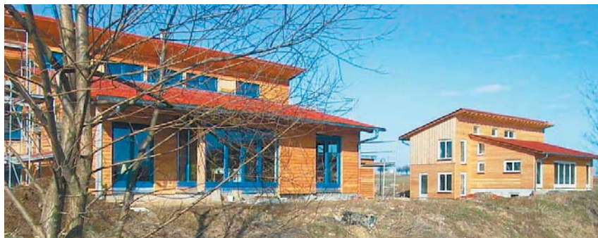
Wird mit BHKW-Abwärme versorgt: Das Ökowohngebiet in Wolpertshausen.

In Ausgabe 14 porträtierten wir ein Anlagenkonzept zur Beheizung von Gebäuden durch Biomasseheizkraftwerke. Diesmal stellen wir ein Konzept aus Wolpertshausen bei Schwäbisch Hall vor: Hier wird die Abwärme einer Biogasanlage zur Beheizung verschiedener Gebäude genutzt.